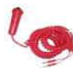
Doublage* arrivée manuelle

* IMPORTANT : Lors de l'utilisation d'un système automatique et semi-automatique, il est souhaitable que doubler par un chronométrage manuel.