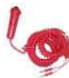
Poire d'Arrivée Manuelle